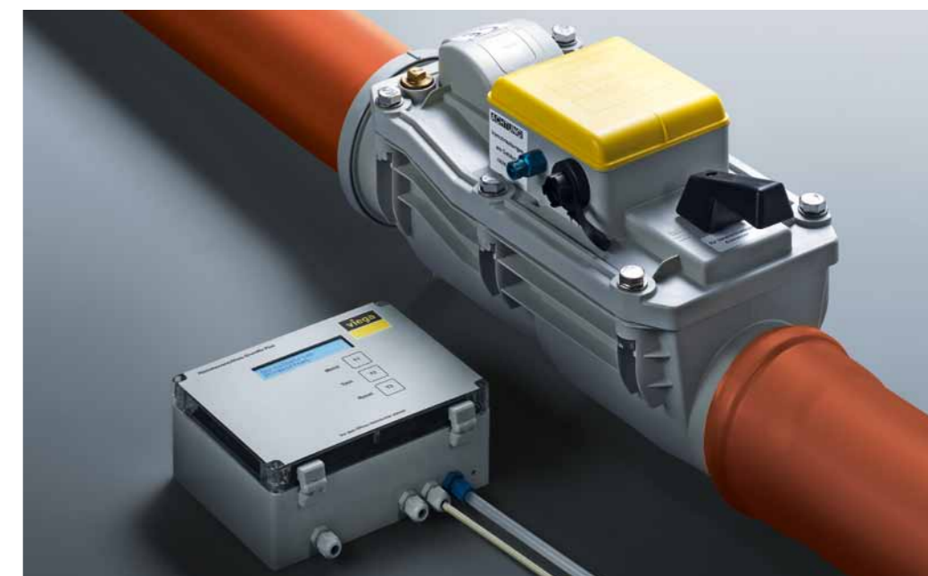
Viega Grundfix Plus - til fækalieholdigt vand.

Viega Grundfix Plus. Ved tilbageløb udløses et optisk og akustisk signal. Tilbageløbssikringen lukker automatisk. Når tilbageløbet ophører åbner tilbageløbssikringen igen.