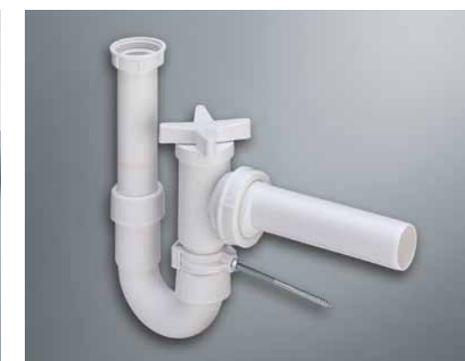
Viega Sperrfix 3, rørvandlås med tilbageløbssikring.

Sperrfix 3 rørvandlås type 5, med tredobbelt sikring (2 automatiske og 1 manuel lukker). Fremstillet af miljøvenligt polypropylen (PP) af høj kvalitet. Materialet er korrosionsfrit og velegnet til varmt vand samt afløbsvand fra boliger. Viega Sperrfix 3 leveres med praktisk vægholder.