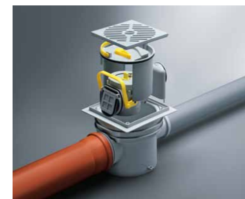
Viega Optifix 3, kælder afløb med tilbageløbssikring.